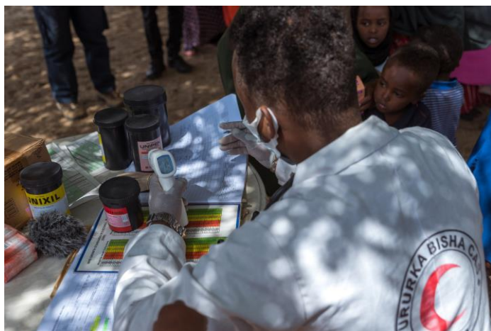
Sjuksköterska vid hälsoklinik.

I Somalia är tillgången till vård begränsad för många människor. Landet har en av världens högsta dödlighet för barn under fem år. De vanligaste dödsorsakerna bland barn är lunginflammation, diarré och mässling – sjukdomar som alla kan behandlas med rätt medicinsk vård. Därför stödjer vi Somaliska Röda Halvmånens hälsoprogram som ger tillgång till hälso-och sjukvård genom mobila och stationära hälsokliniker. Genom klinikerna når vi fram till människor i mycket avlägsna regioner med grundläggande sjukvård, mödra- och barnvård. Klinikerna gör särskilda insatser för att upptäcka barn som riskerar undernäring och ge näringssupplement till de som behöver det så att de kan växa och