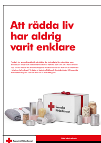
Affischer 70x100, 50x70 och A3