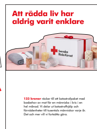
Popup-kort 210x140 mm