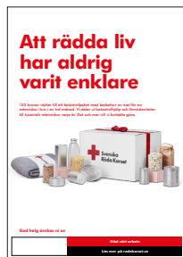
Eventaffischer A3 och A4 egen utskrift, ändringsbar