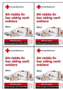
Bösskyltar 4/A4 egen utskrift