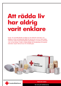
Syltar A4 och A5, egen utskrift