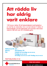
Annonssmall, 122x178 mm, ändringsbar