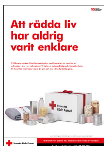
Affischer 50x70 och A3