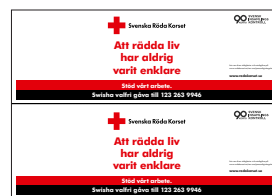
Bössbanderoller 2/A4 egen utskrift